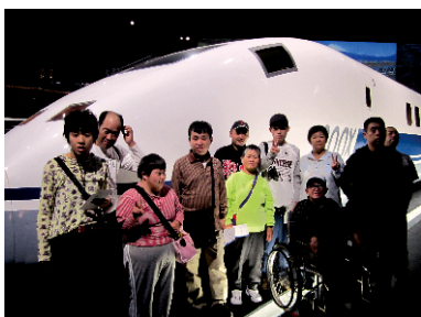
かっこいいリニア・鉄道館