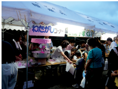
無料模擬店は長蛇の列ができるほどの人気

恒例の納涼祭も今年で23回目。日頃お世話になっている協力企業、地域の民生委員、県市議会議員の皆様をはじめ、多数の近隣住民の皆様に参加していただき、大変な盛り上がりでした。