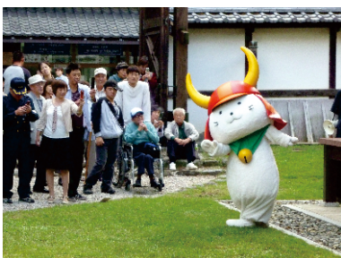
かわいいひこにゃんは人気者

利用者と保護者、職員の総勢95名で1泊2日の慰安旅行に行ってきました。今年は彦根城、大河ドラマのお江人気に沸く長浜、リニア・鉄道館、名古屋港水族館を巡り、たくさんの楽しい思い出を作ることができました。