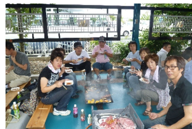
ご馳走でお腹がいっぱいになれば、自然に笑顔とピースがあふれます