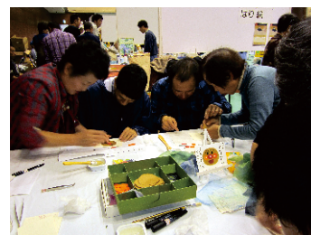
絵手紙が上手にできたかな？

第31回ふれあい広場が浜北グリーンアリーナにて開催され、たちばな授産所も参加しました。利用者の皆さんは会場内の出展ブースを見学したり、スタンプラリーなどを楽しみました。また、保護者会による日用品、手芸品等のバザーも好評でした。